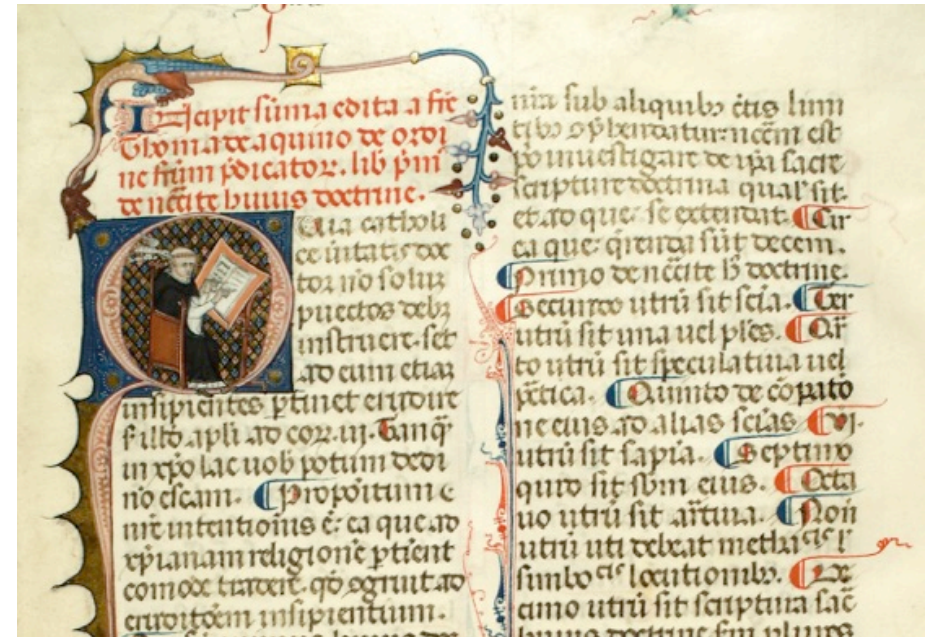
Summa theologiae, I a Pars – © Biblioteca Apostolica Vaticana, Vat. lat. 731, f. 9r détail