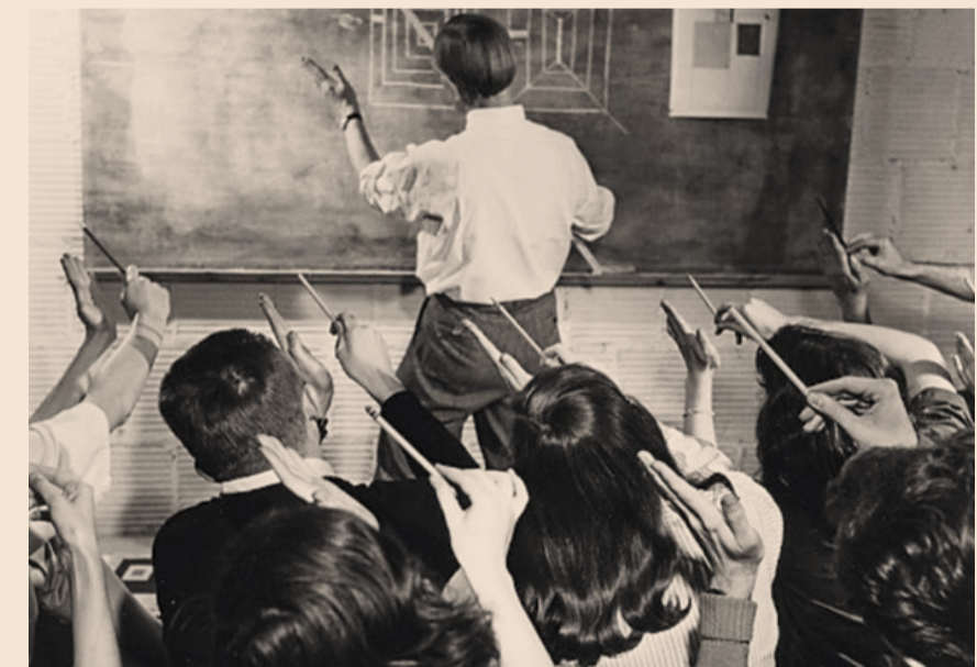
ALLEGORIA DELL'INSEGNAMENTO | Scuola statunitense negli anni Cinquanta

* Filosofo, Università Roma Tre, Vicepresidente della Consulta Nazionale di Filosofia ** Matematica, Università di Pisa, Delegato alla formazione degli insegnanti dell'Università di Pisa